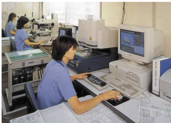
「品質保証・検査」様子